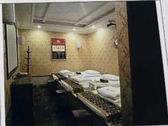
估价对象 1-90 现状