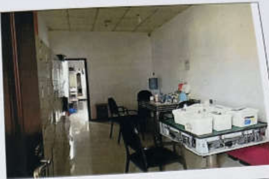
估价对象 1-90 现状