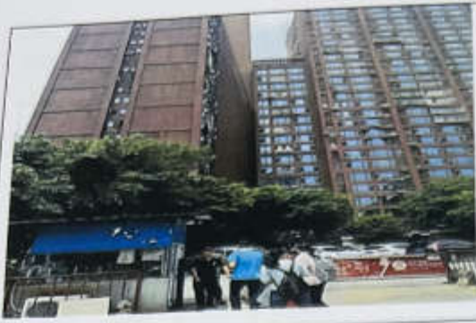
估价对象 109-115 建筑物外观现状