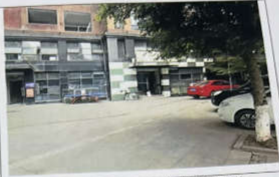
估价对象 109-115 建筑物外观现状