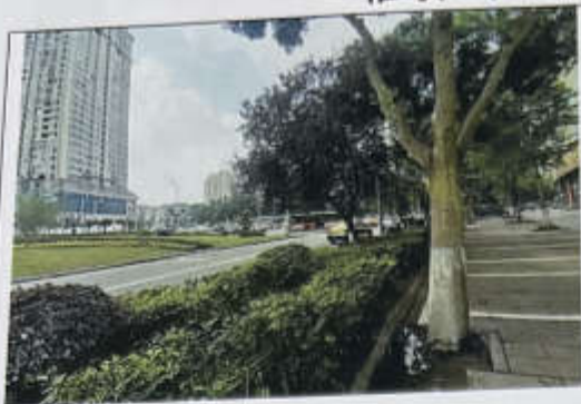
估价对象 1-109 环境现状