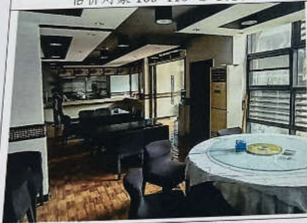
估价对象 109-115 现状