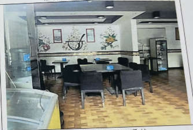
估价对象 109-115 现状