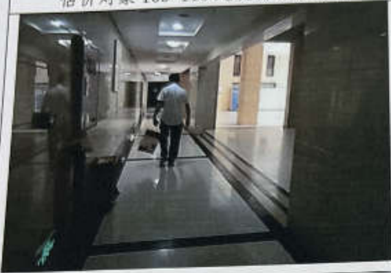
估价对象 109-115 通道现状