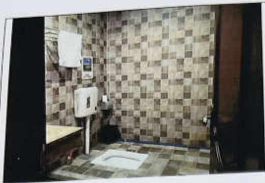
估价对象 1-90 现状