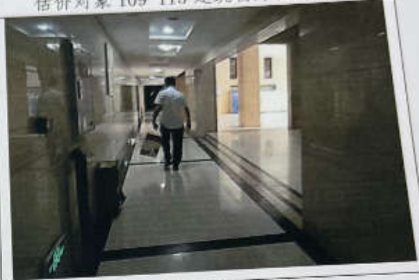
估价对象 109-115 现状