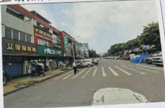
估价对象 1-109 环境现状