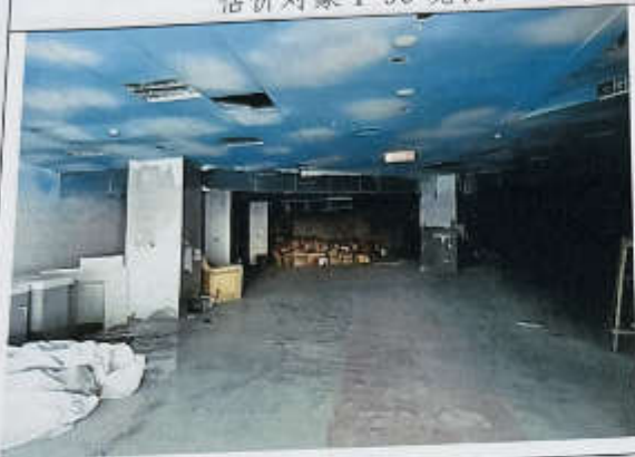
估价对象 1-90 现状