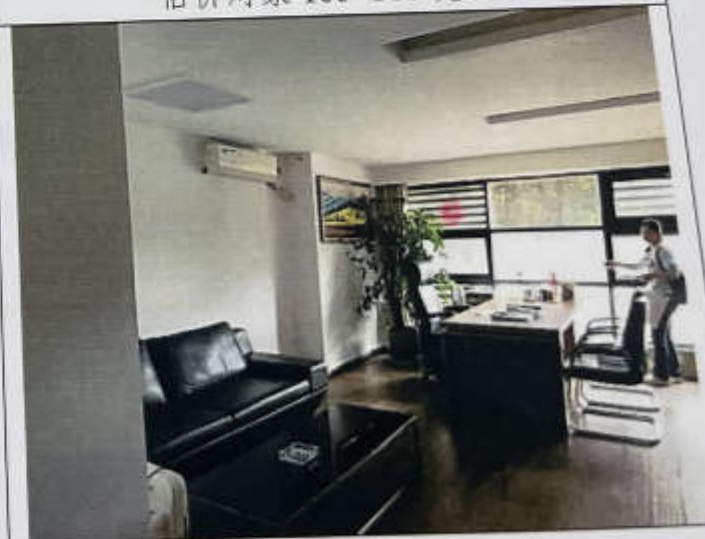
估价对象 109-115 现状