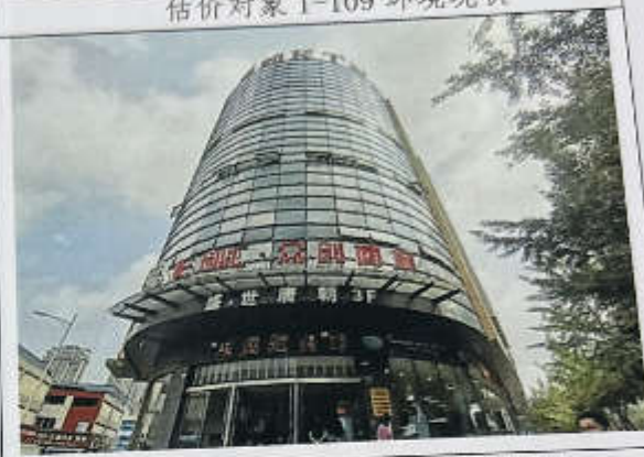
估价对象 1-109 建筑物外观现状