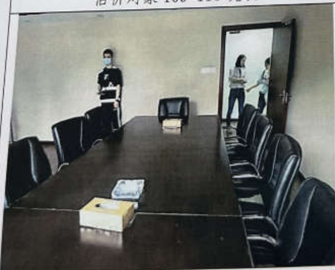
估价对象 109-115 现状