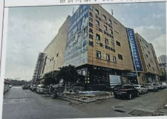
估价对象 1-109 建筑物外观现状