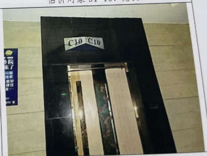
估价对象 108 现状