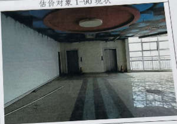
估价对象 1-90 现状