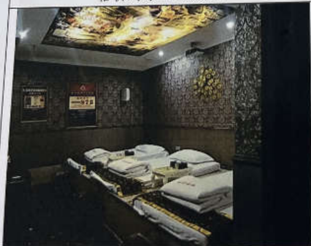
估价对象 1-90 现状