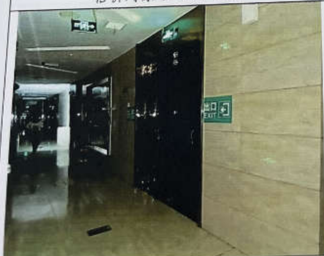
估价对象 108 通道现状