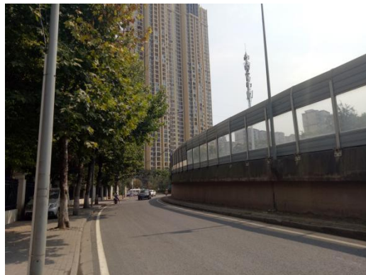
项目临路状况 2 (秀水路)