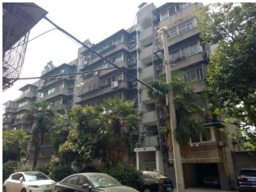
估价对象所在楼栋外观