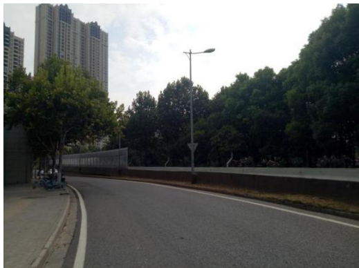
项目临路状况 1 (秀水路)