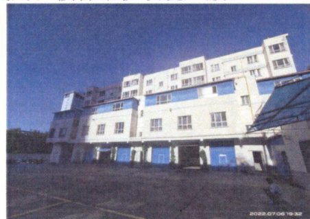
估价对象现场照片