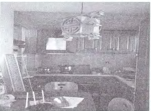
估价对象内部现状