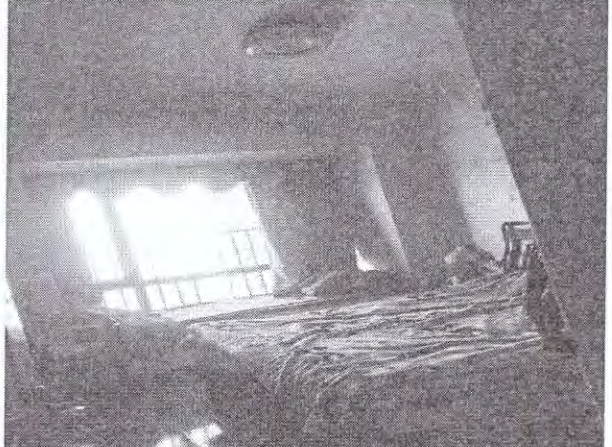
估价对象内部现状