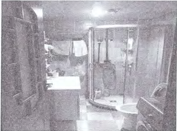
估价对象内部现状