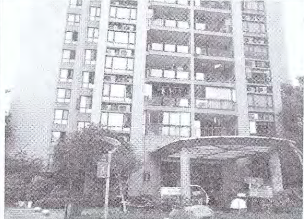
估价对象外部状况