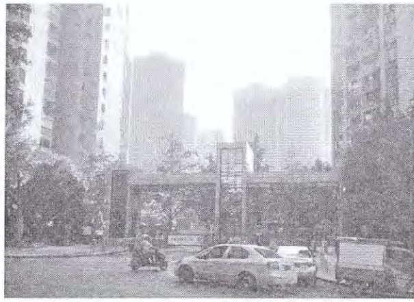
估价对象外部状况