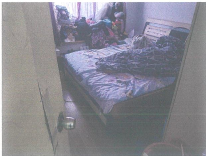
估价对象内部照片