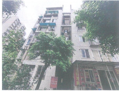
估价对象楼幢外观照片