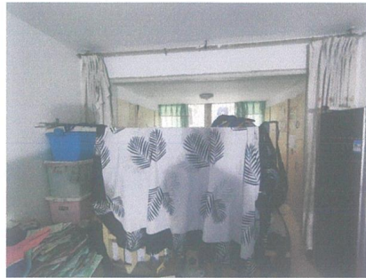
估价对象内部照片