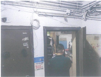
估价对象入户现状照片