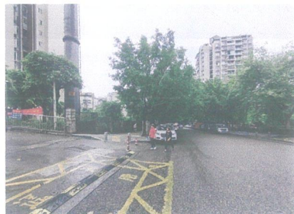
估价对象周边环境照片