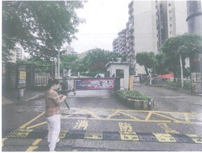
估价对象所在小区入口照片