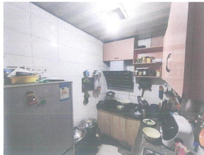
估价对象内部照片