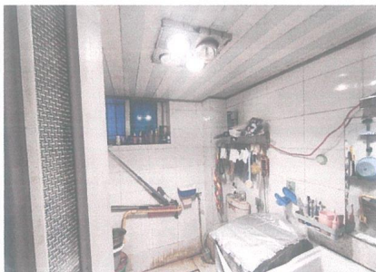
估价对象内部照片