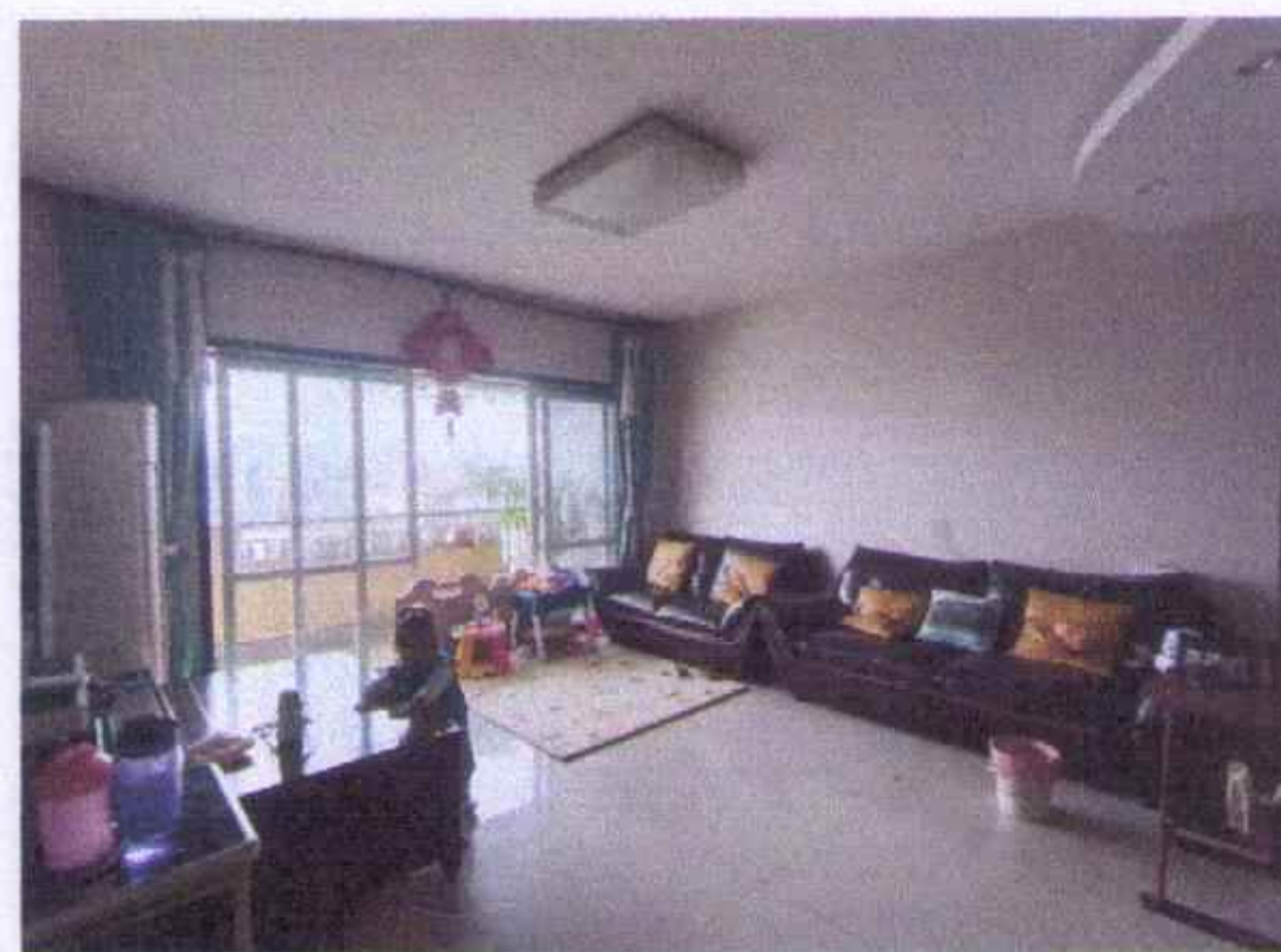
估价对象内部照片