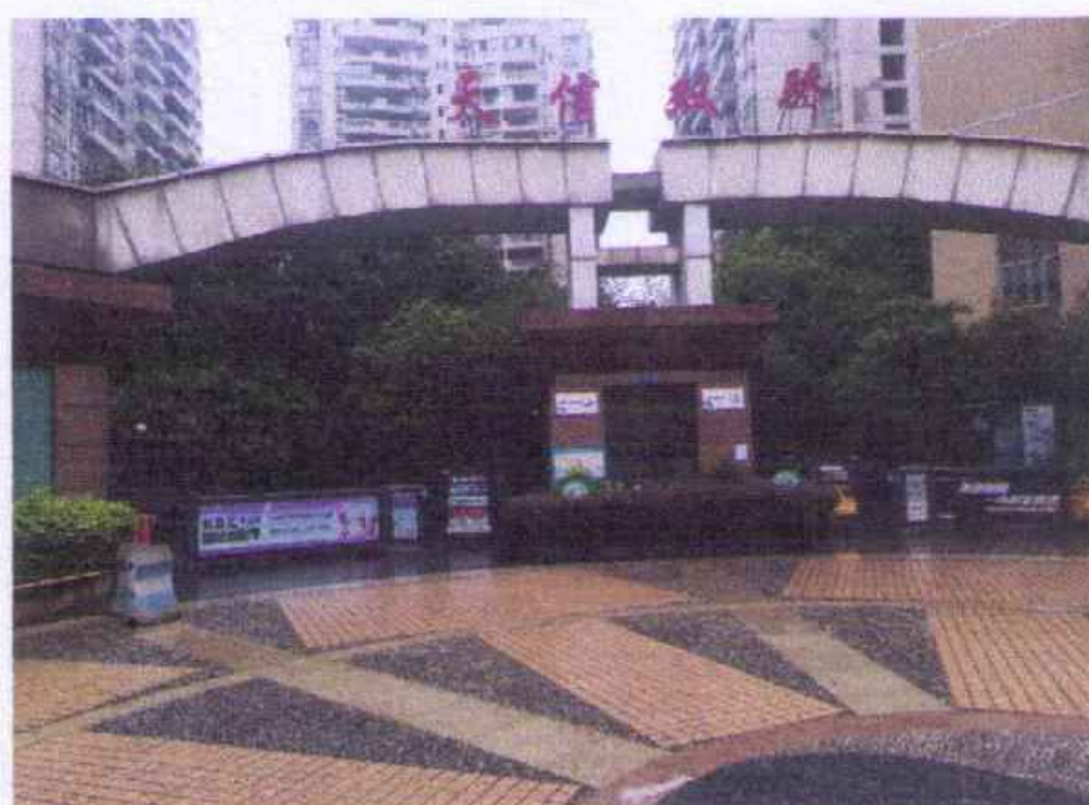
估价对象小区入口照片