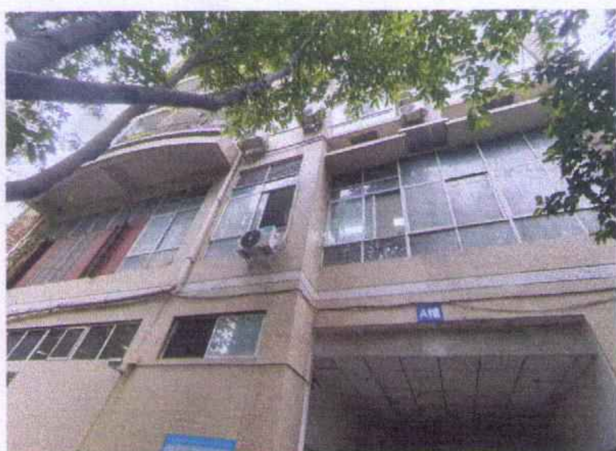
估价对象楼栋外观照片