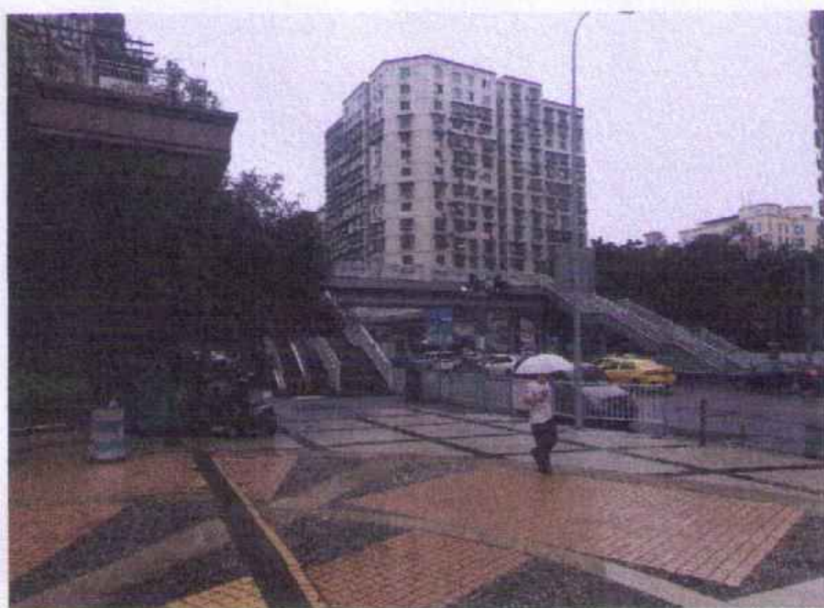
估价对象周边环境