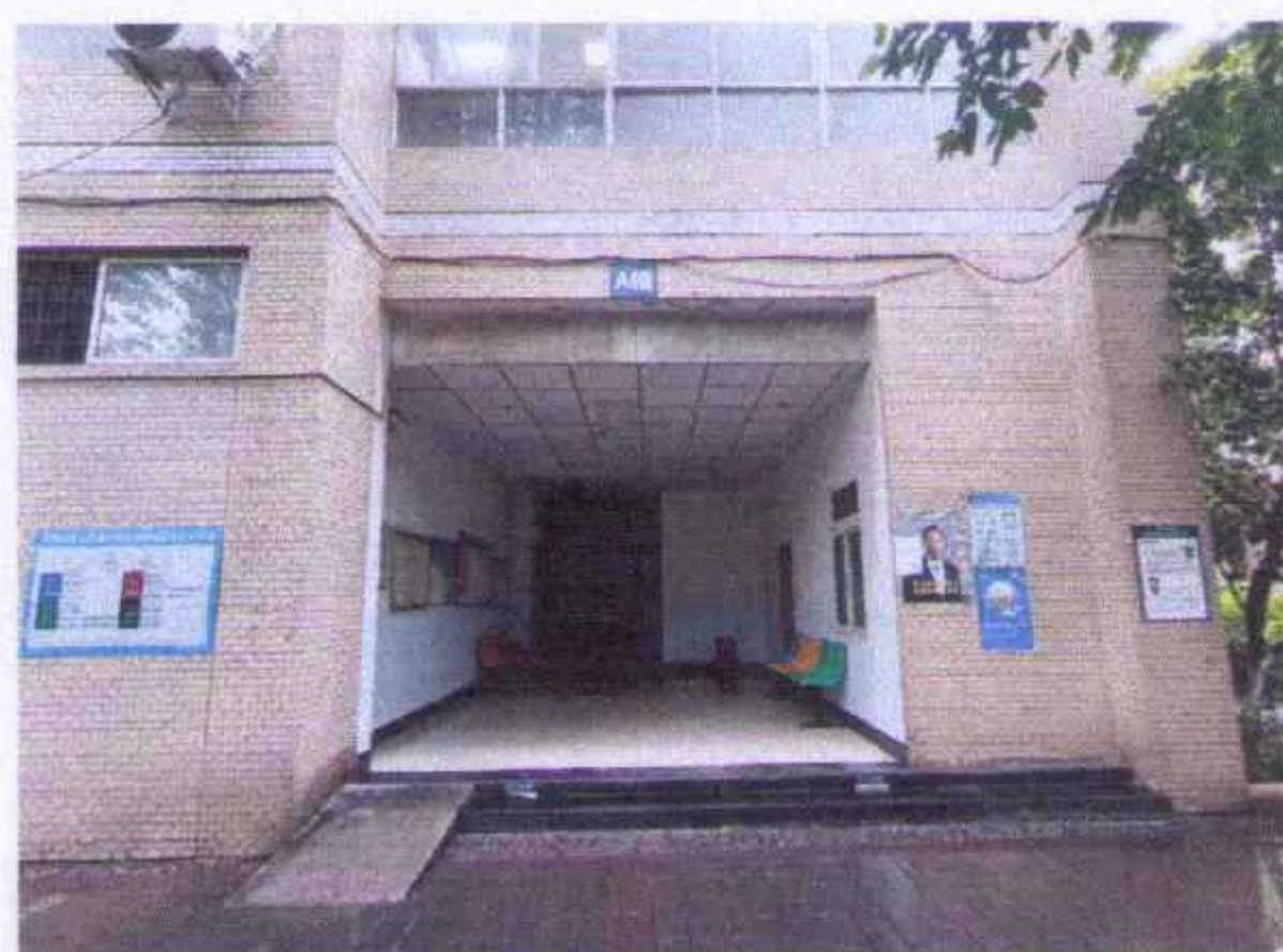
估价对象楼栋照片