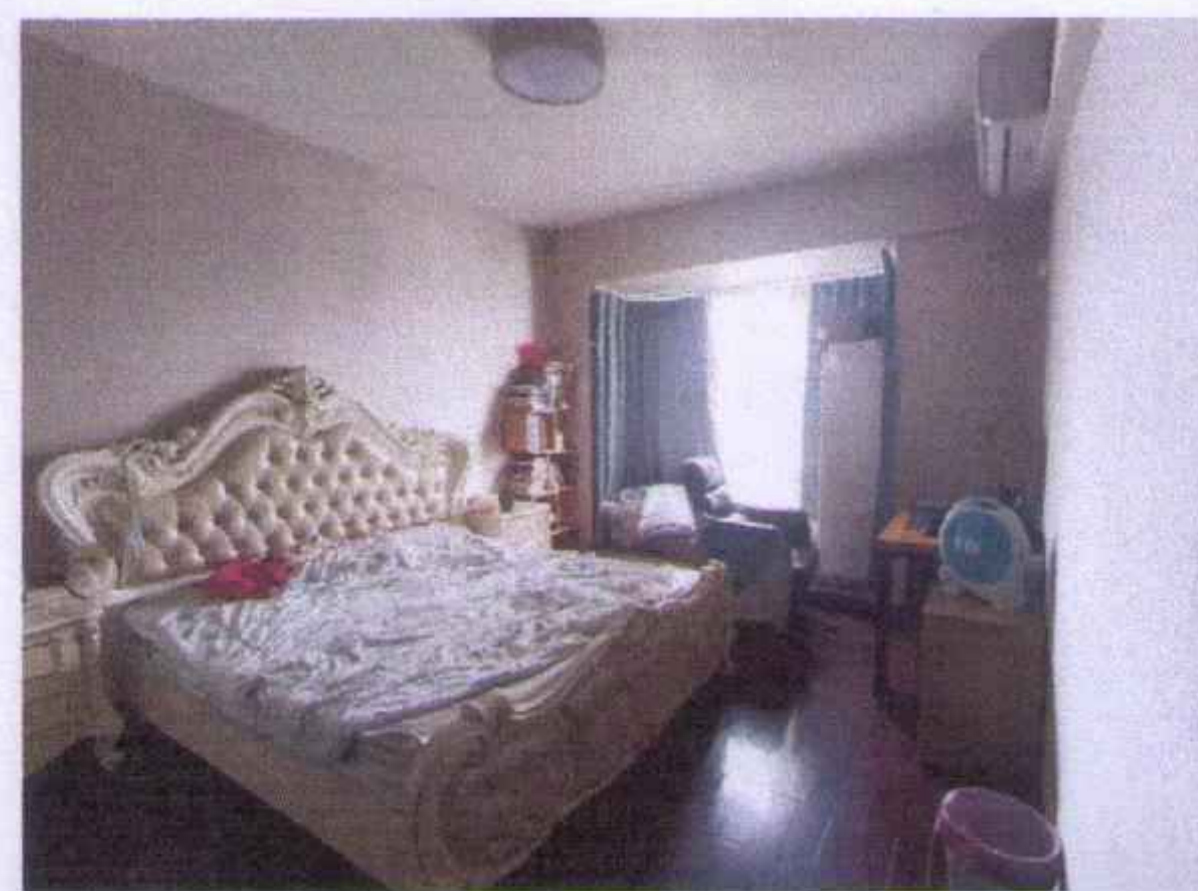
估价对象内部照片