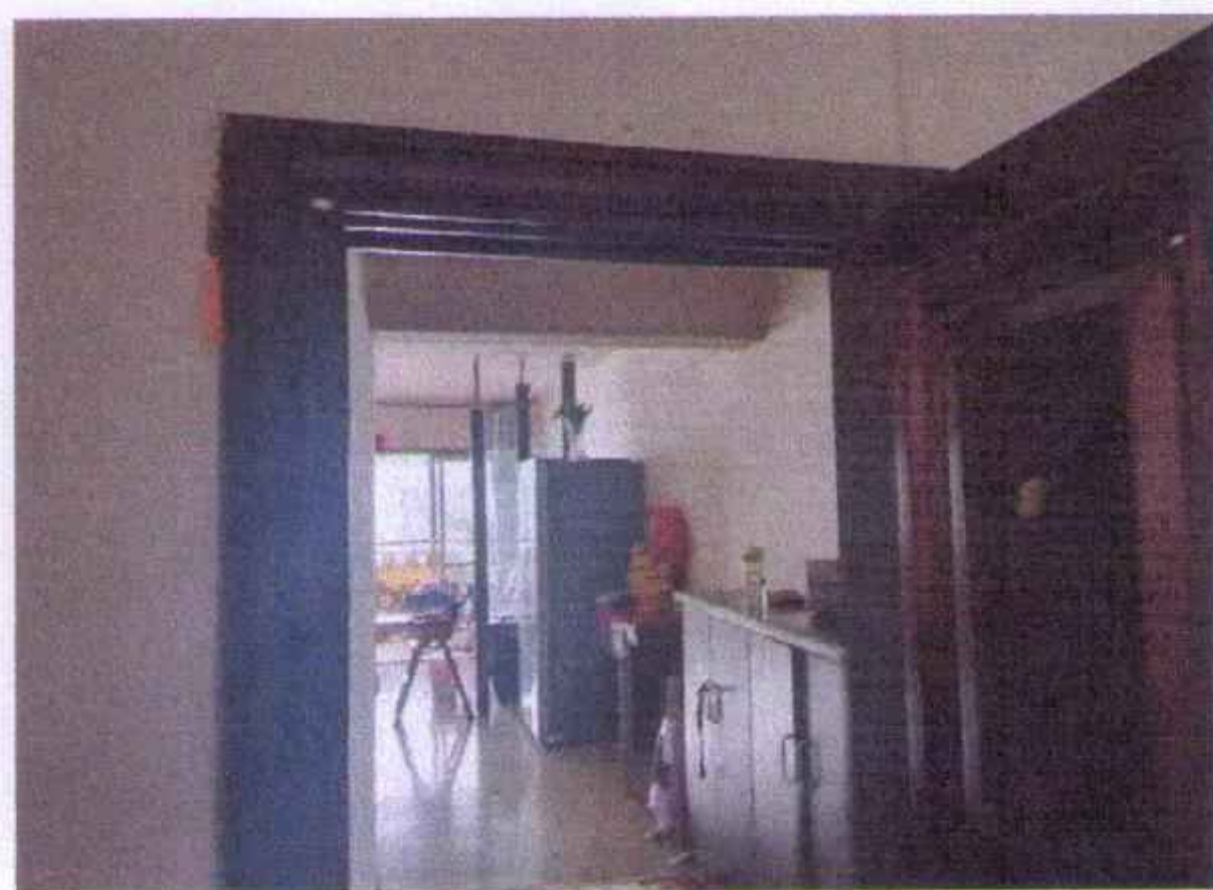
估价对象入户照片