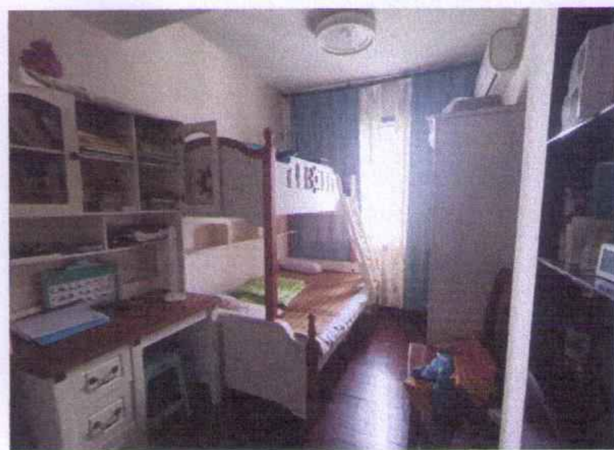
估价对象内部照片