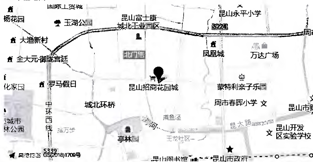
图 3-2 招商花园城周边配套设施分布图