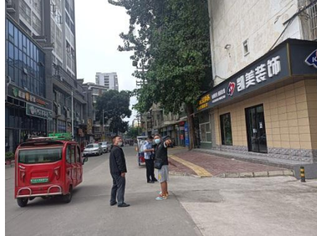
估价对象周边区域现状