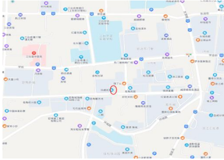
画圈处为估价对象所在位置