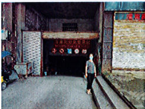
估价对象车库入口: