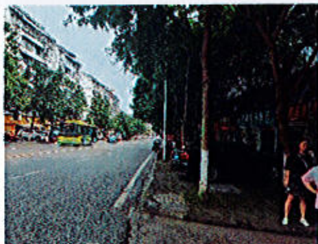
估价对象周边街道: