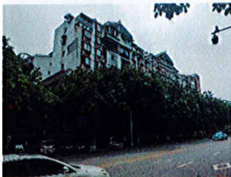
估价对象大楼外观: