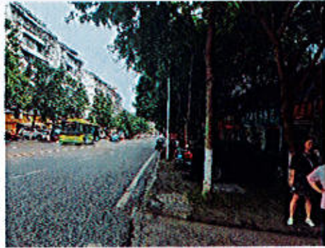
估价对象周边街道：