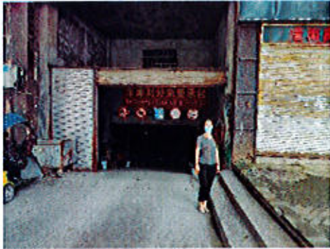
估价对象车库入口：