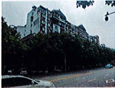
估价对象大楼外观：