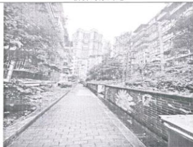
估价对象所在小区内部环境