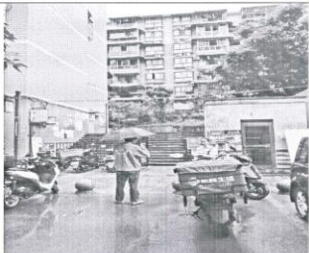
估价对象所在小区大门