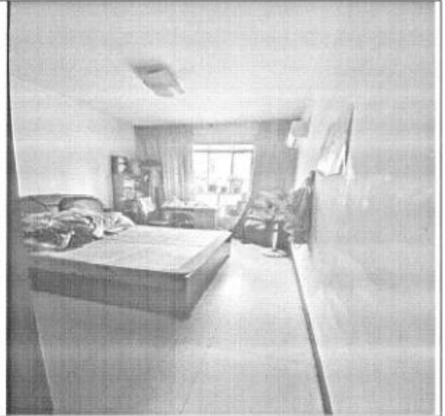
估价对象室内现状