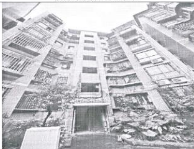
估价对象所在楼幢