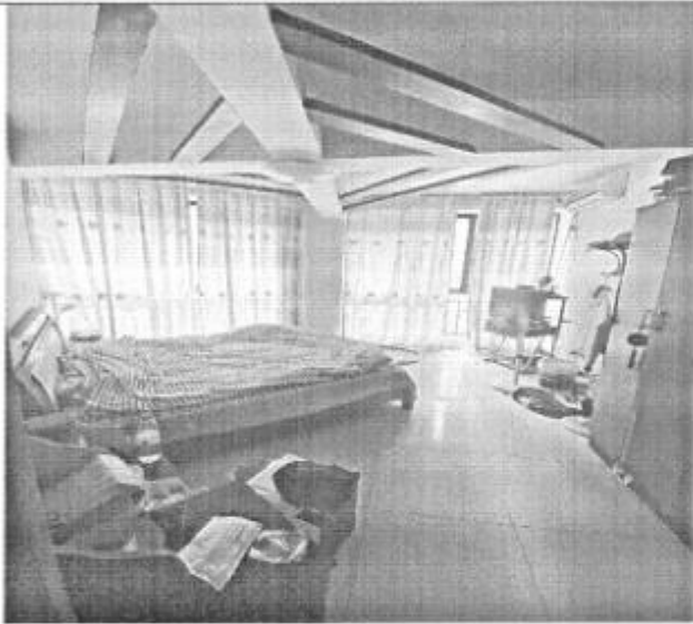
估价对象室内现状