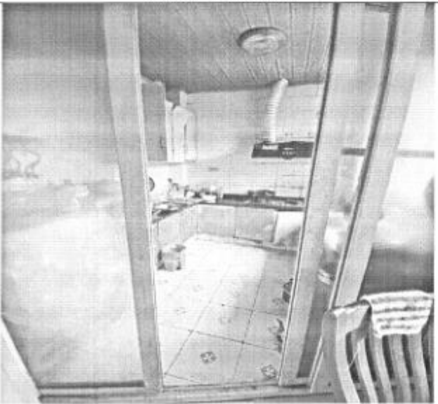
估价对象室内现状