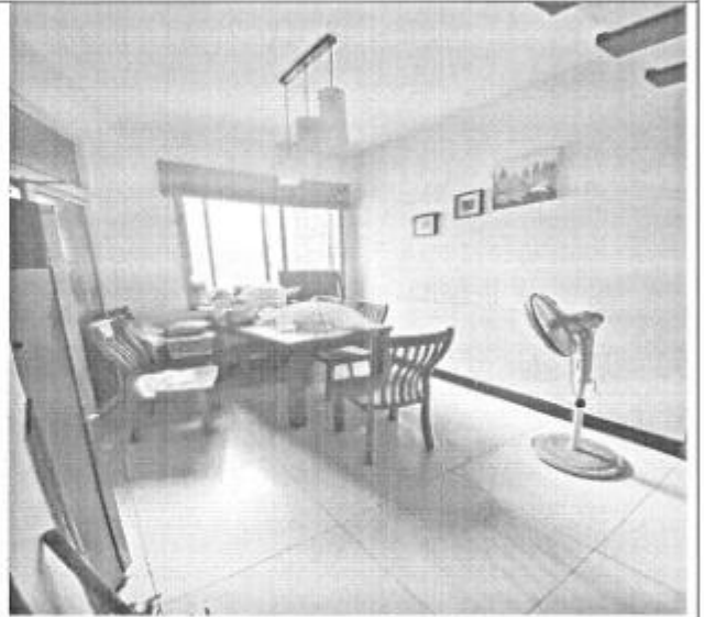
估价对象室内现状