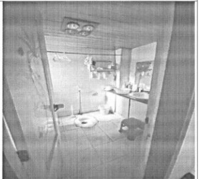
估价对象室内现状