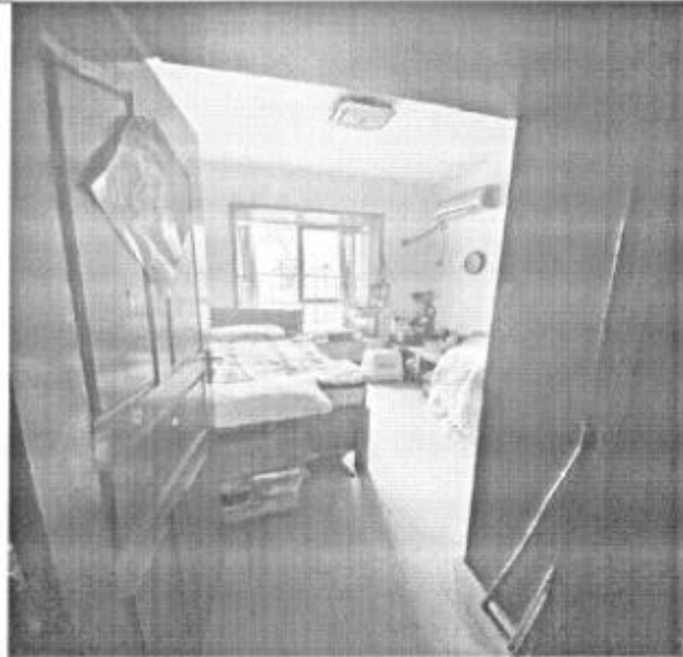
估价对象室内现状