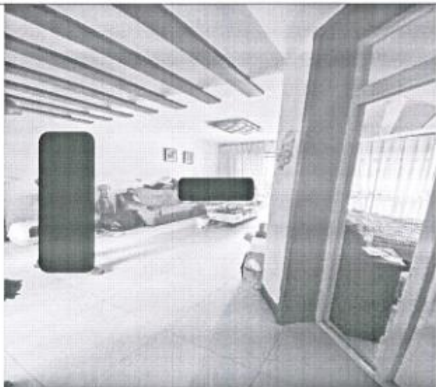
估价对象室内现状