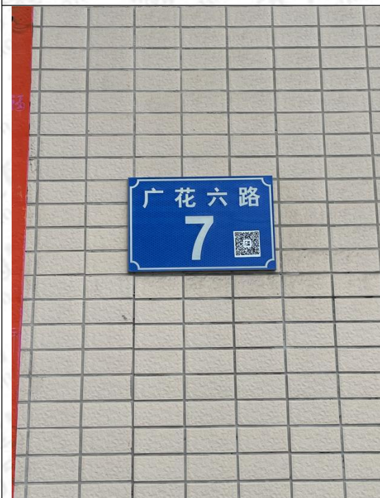
楼宇行政地址（门牌）