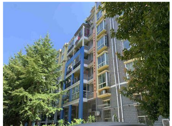
估价对象所在楼栋外观