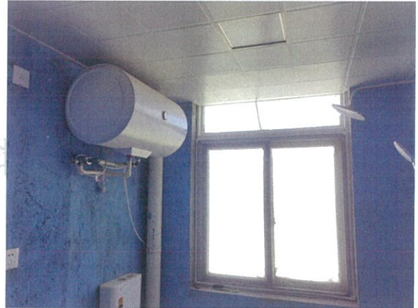
估价对象室内状况四