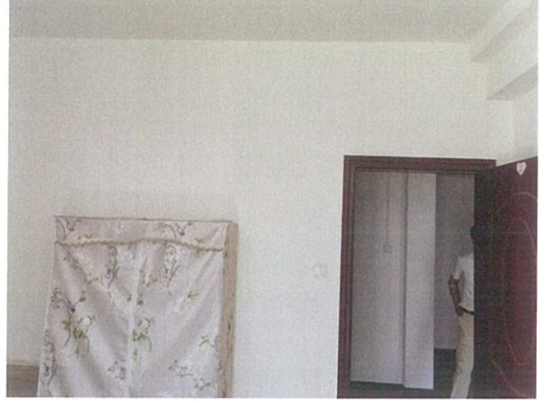
估价对象室内状况二