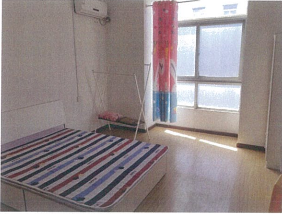
估价对象室内状况一

座落：江夏区纸坊街江夏大道富丽奥林园亚特兰大村 1 栋 4 单元 6-7 层 1 室