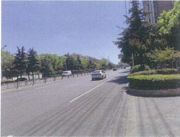
估价对象周边道路一

座落：江夏区纸坊街江夏大道富丽奥林园亚特兰大村 1 栋 4 单元 6-7 层 1 室