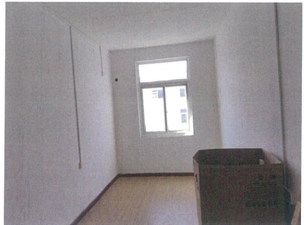
估价对象室内状况六