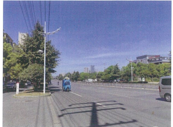
估价对象周边道路二