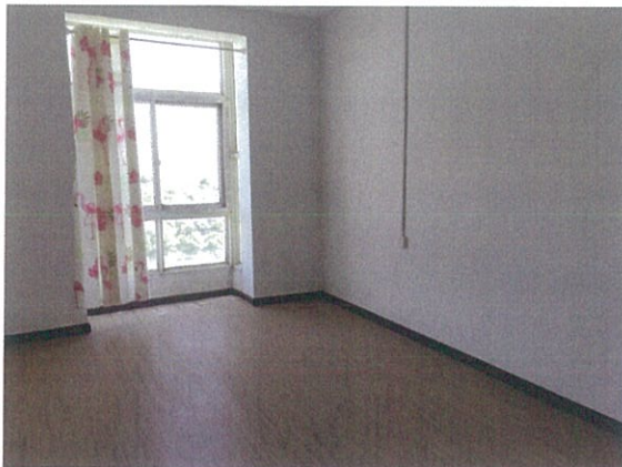
估价对象室内状况五