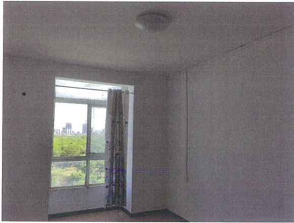
估价对象室内状况三