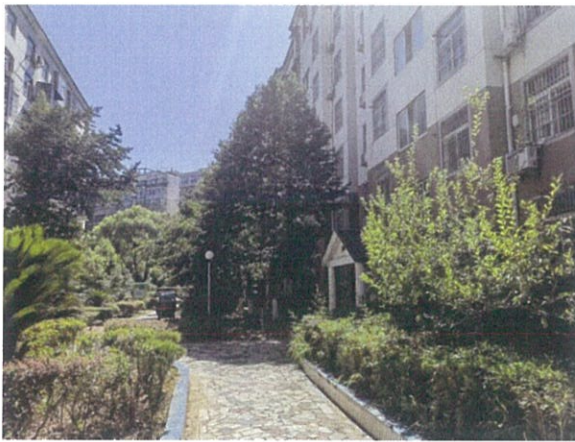
估价对象小区环境