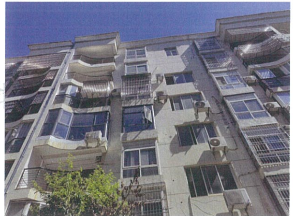
估价对象单元入口