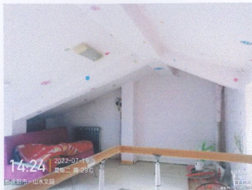
评估对象阁楼照片