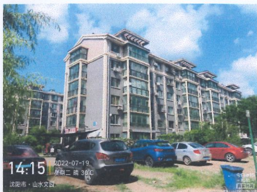
评估对象建筑外观