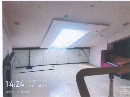
评估对象阁楼照片