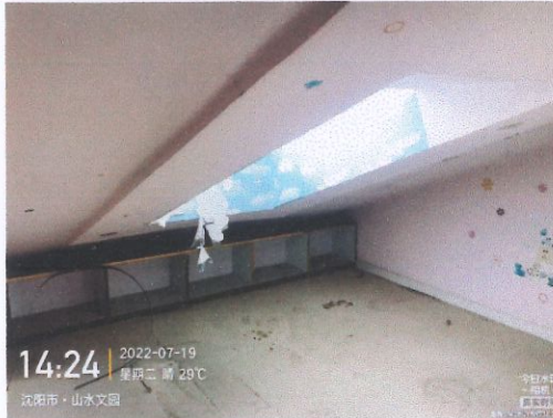
评估对象阁楼照片