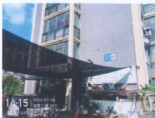
评估对象所在蓝牌号