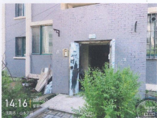
评估对象入户单元门