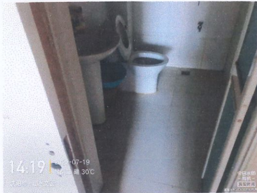
评估对象室内照片