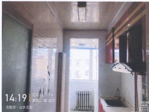
评估对象室内照片