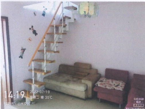
评估对象室内照片