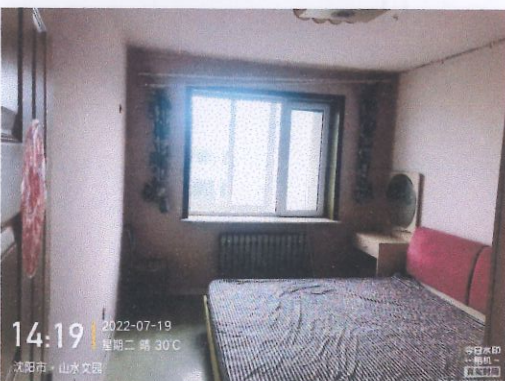
评估对象室内照片