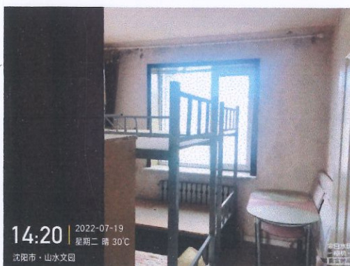
评估对象室内照片