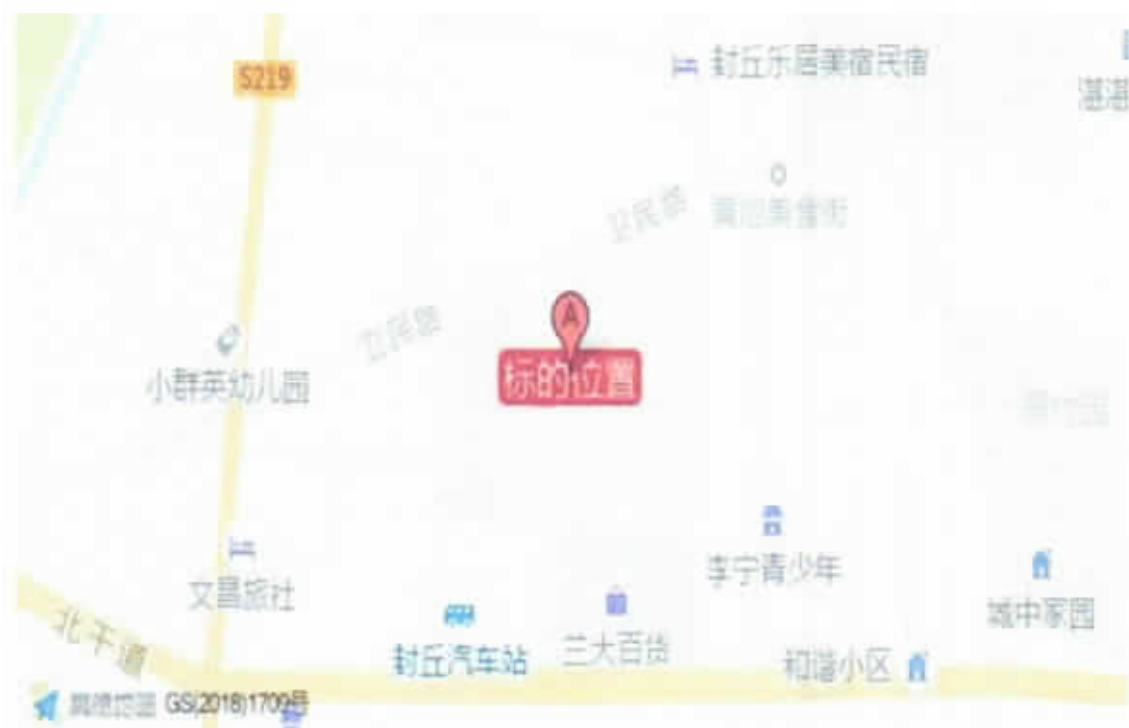
估价对象所在位置示意图