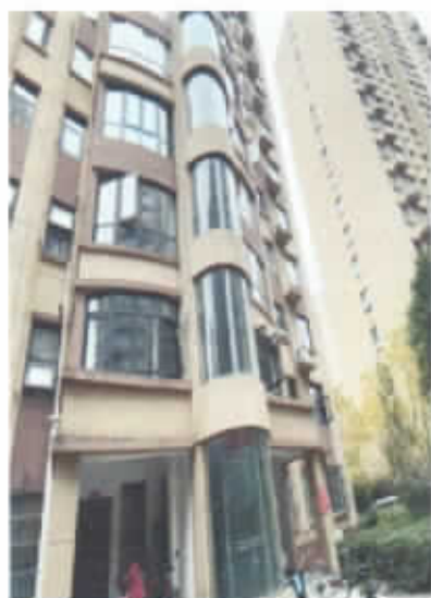
河南省新乡市封丘县佳联国际小区 6 号楼 3 单元 901 室