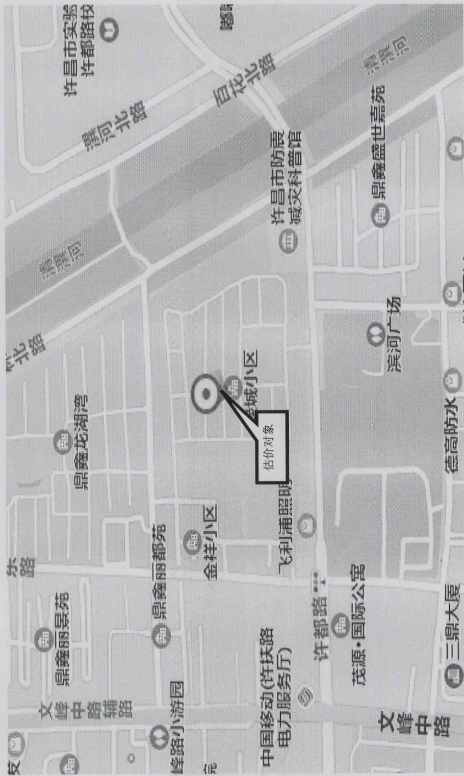
估价对象位置示意图