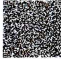
第二步 校验资料证明