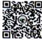
第一步 关注微信公众号

3. 扫描下方二维码关注“常州不动产登记”微信公众号，选择“自助验证自助”，扫码校验本套资料。