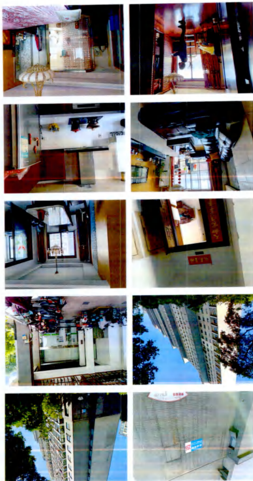
估价对象影像资料