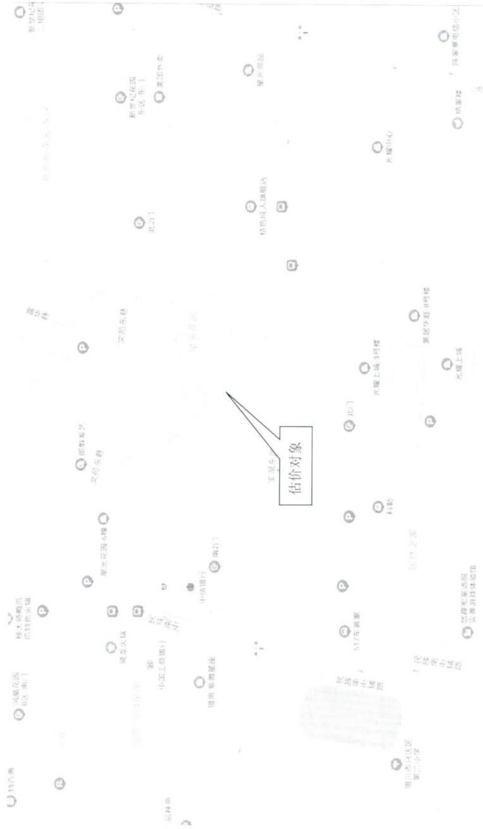
估价对象地理位置示意图