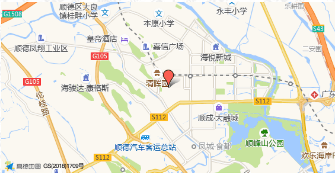
注：数据源自高德地图，标注仅供参考，具体位置以标的物实际为准