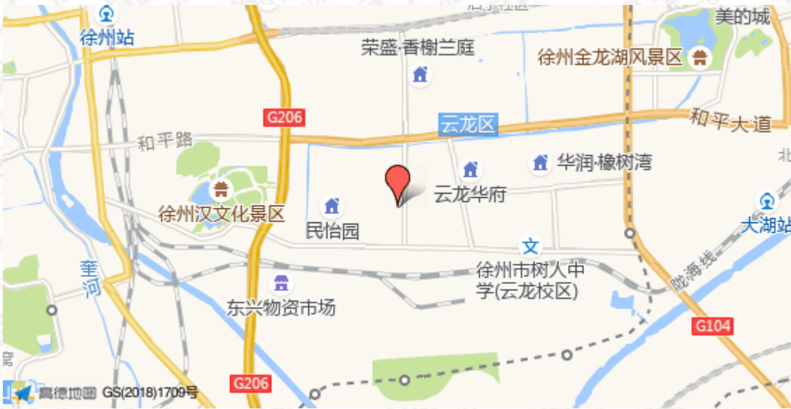
注：数据源自高德地图，标注仅供参考，具体位置以标的物实际为准