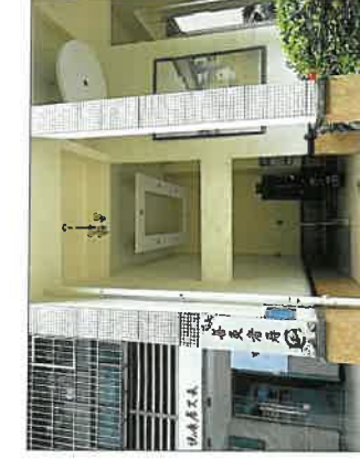
单元号及单元门口现状