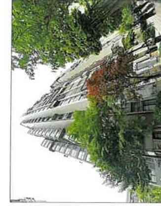
所在楼宇外观现状