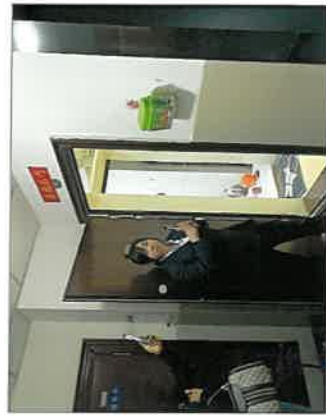
房号及房屋入口现状