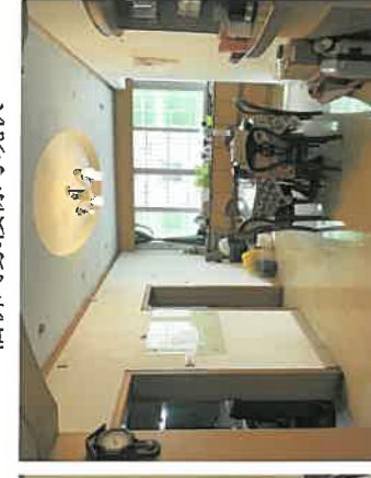
估价对象餐厅现状