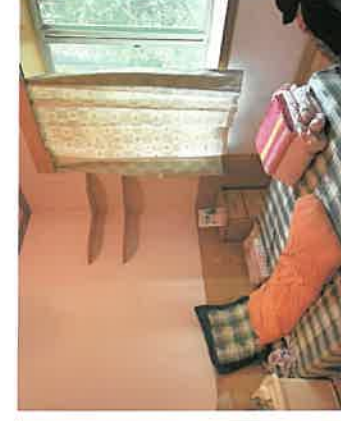
估价对象卧室现状