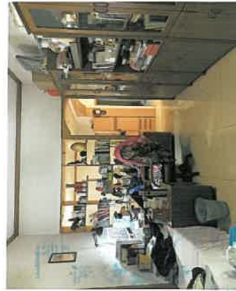
估价对象开放式书房现状