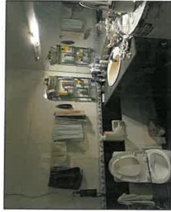
估价对象卫生间现状