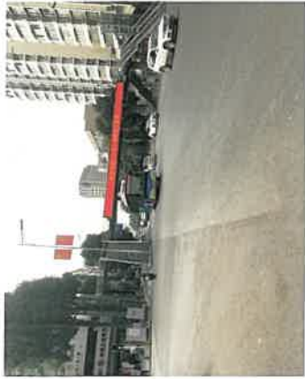
估价对象周边现状