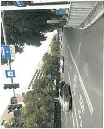
估价对象周边现状