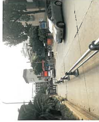
估价对象小区入口现状