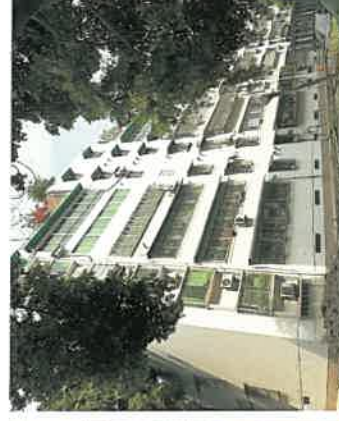
估价对象所在楼宇外观现状