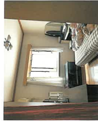
估价对象卧室现状