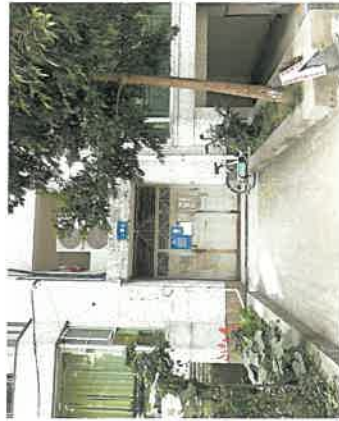
估价对象单元号及单元入口现状