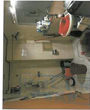
估价对象卫生间现状