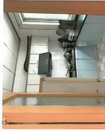
估价对象厨房现状