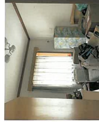
估价对象卧室现状