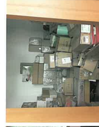
估价对象卧室现状