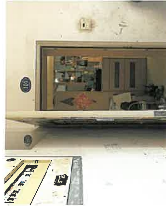
估价对象入户门及门牌号现状