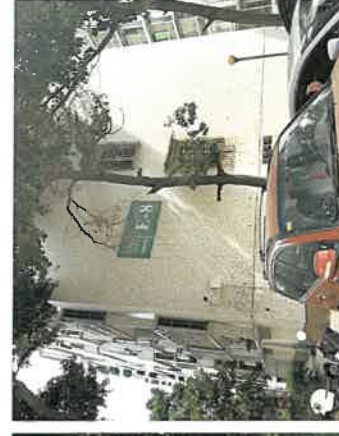
估价对象楼栋号现状