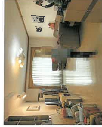
估价对象客厅现状