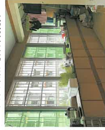
估价对象客厅阳台现状