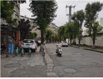
估价对象周边现状