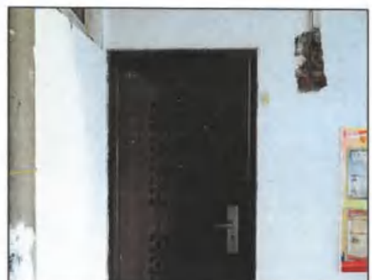
估价对象入户防盗门