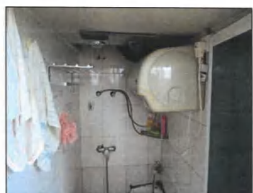
估价对象自搭自建卫生间