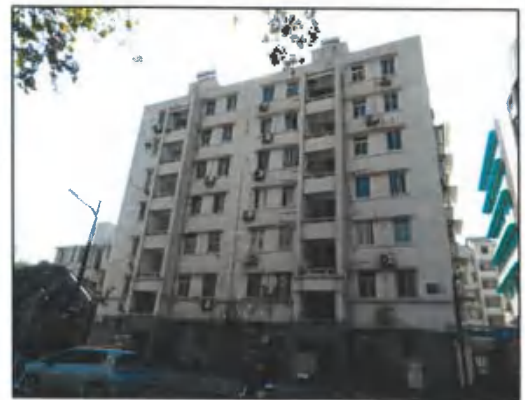
估价对象建筑物外观