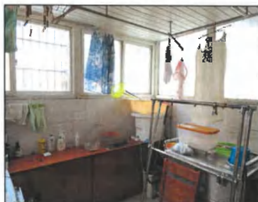
估价对象自搭自建阳台