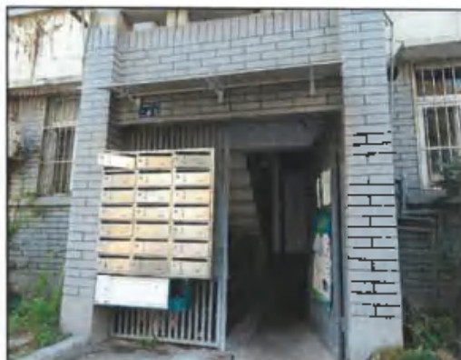
估价对象单元门入口