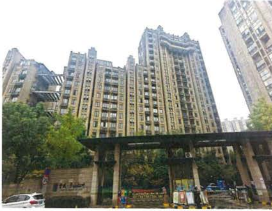
建筑物外立面及小区大门