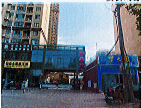
估价对象内外部照片