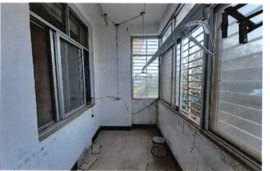
委估住房相关照片