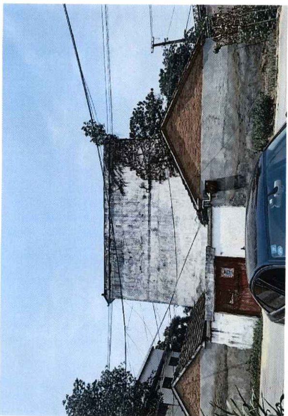
委估住房相关照片