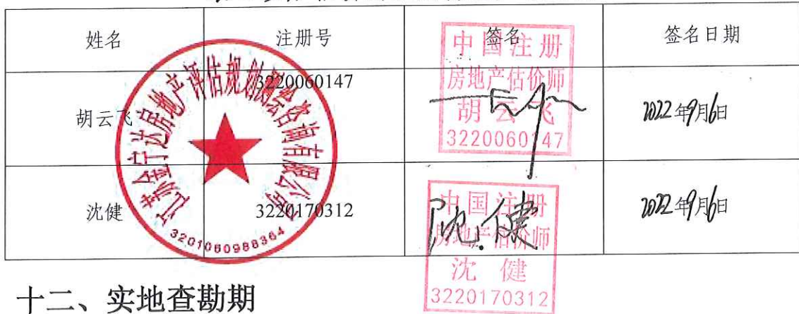
表 3 参加估价的注册房地产估价师