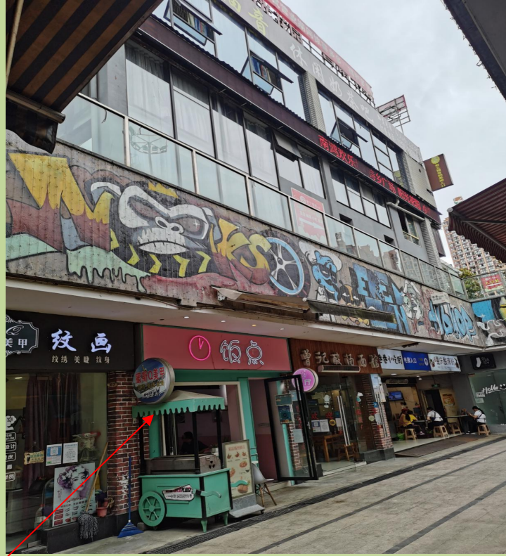
估价对象项目I所在楼栋外观

因司法处置涉及的项目I位于绥阳县诗乡广场一套商业用房、项目II位于绥阳县凯旋公 估价项目名称：寓一套住宅用房、项目III位于遵义市长新军 港一套商业用房、项目IV位于遵义市华义商 住楼一套商业用房房地产市场价值评估