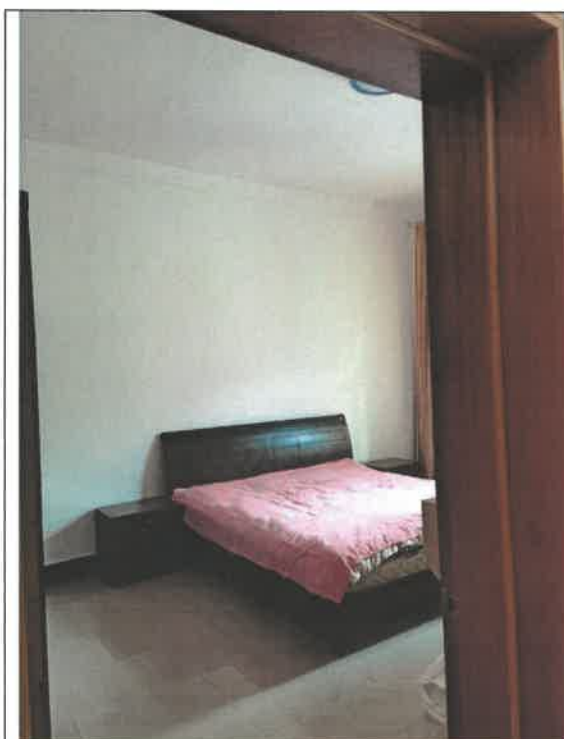
估价对象第 3 层室内