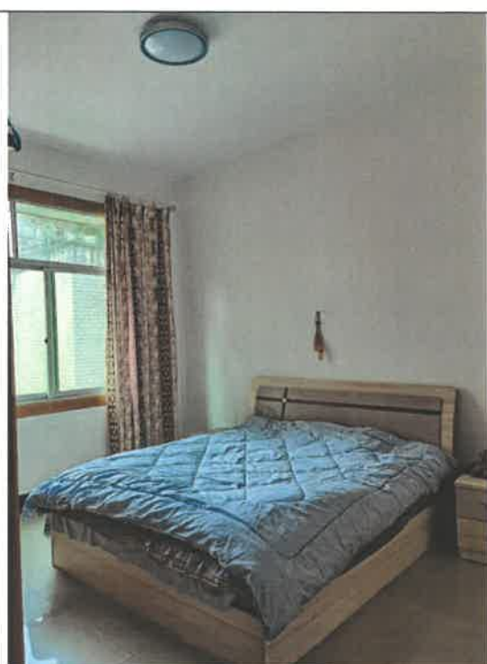
估价对象第 3 层室内