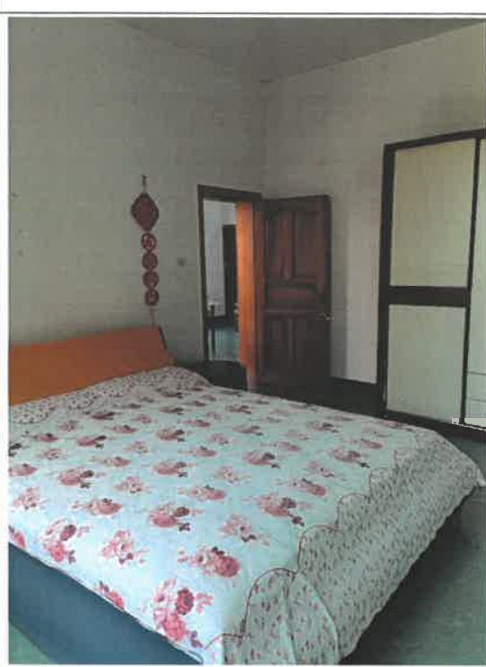
估价对象第 4 层室内