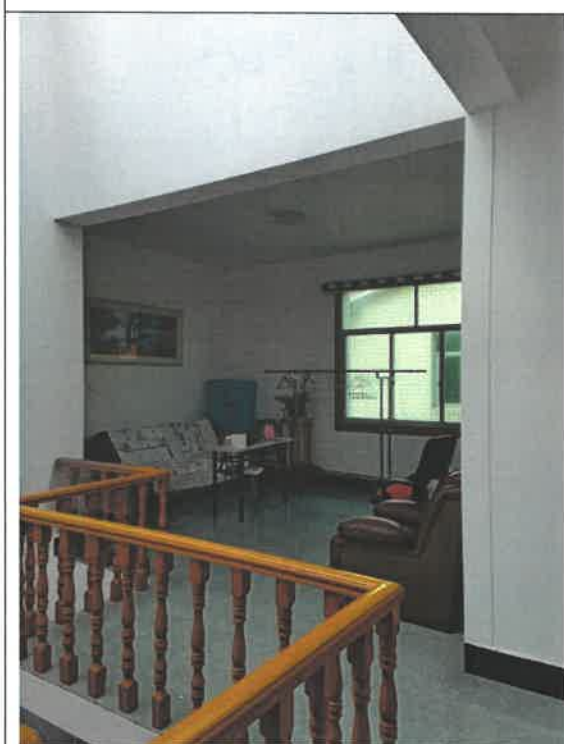
估价对象第 4 层室内