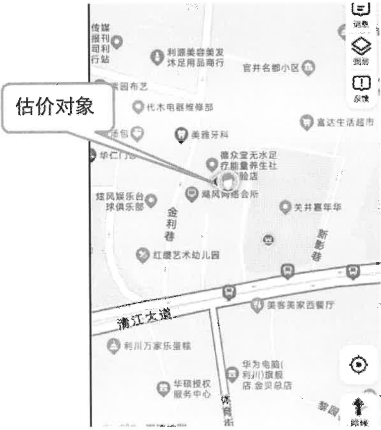
估价对象坐落位置示意图