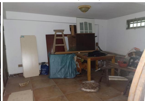
◆室内状况 ( 负一层车库 ) ◆