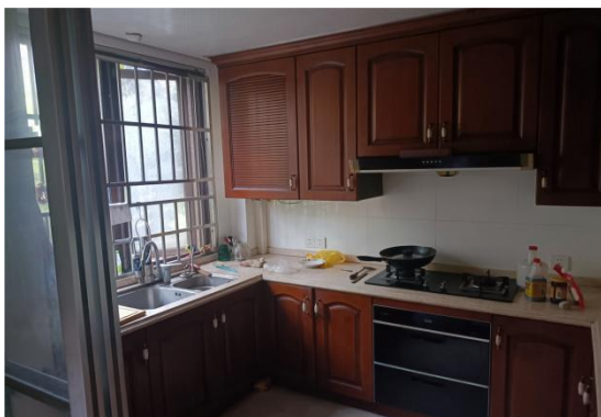
◆室内状况 ( 厨房 ) ◆