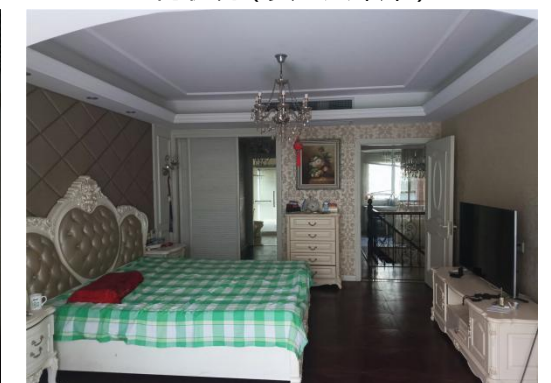
◆室内状况 ( 二层主卧 ) ◆