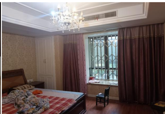
◆室内状况 ( 次卧 ) ◆