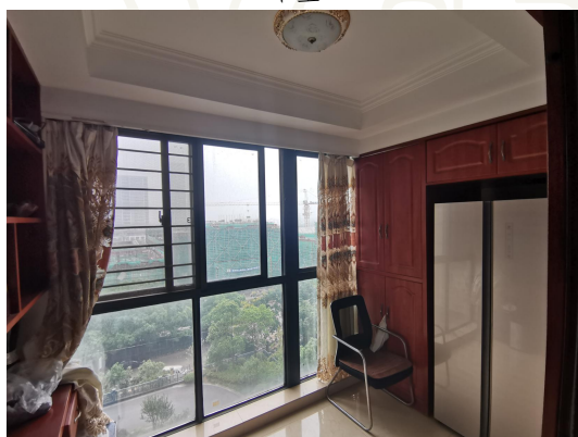
餐厅北侧现书房及储藏间（原挑空）