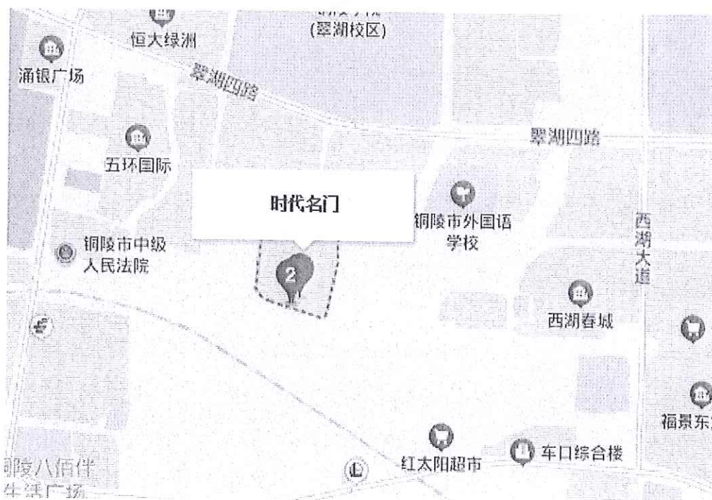
估价对象示意图（图中标识为估价对象位置）

场、翠湖公园等场所，有卢氏中医医疗设施，区域内大型超市、零售、餐饮等商服项目，有中国建设银行等、中国工商银行、中国银行等金融服务业，附近设有公交车站，有 62 路等公交车经过，区位优势较明显。