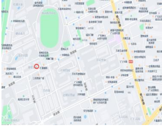
估价对象所在地理位置