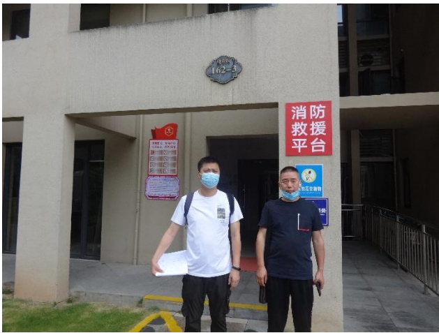
单元入口（估价师实地查勘照片）