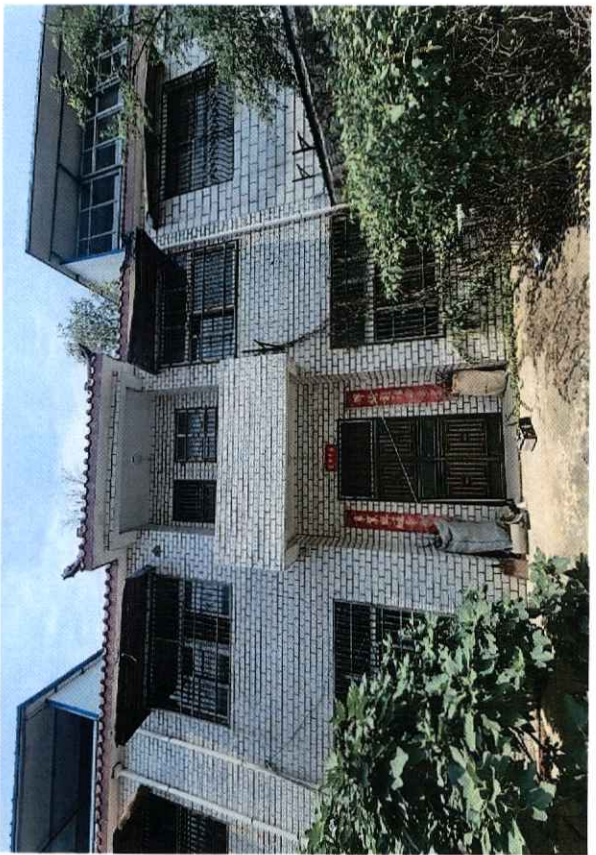
委估房地产相关照片