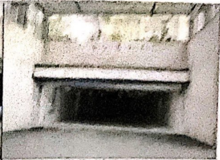
估价对象车库入口