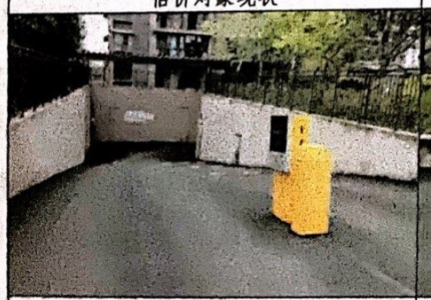
估价对象车库出口