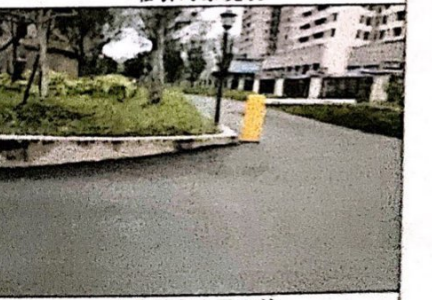
估价对象小区环境