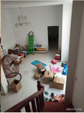
地下室与车库连接门