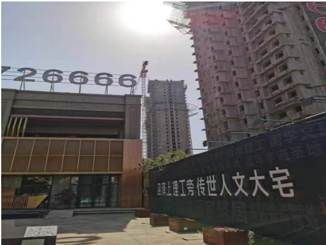
估价对象外部及周围环境和景观照片