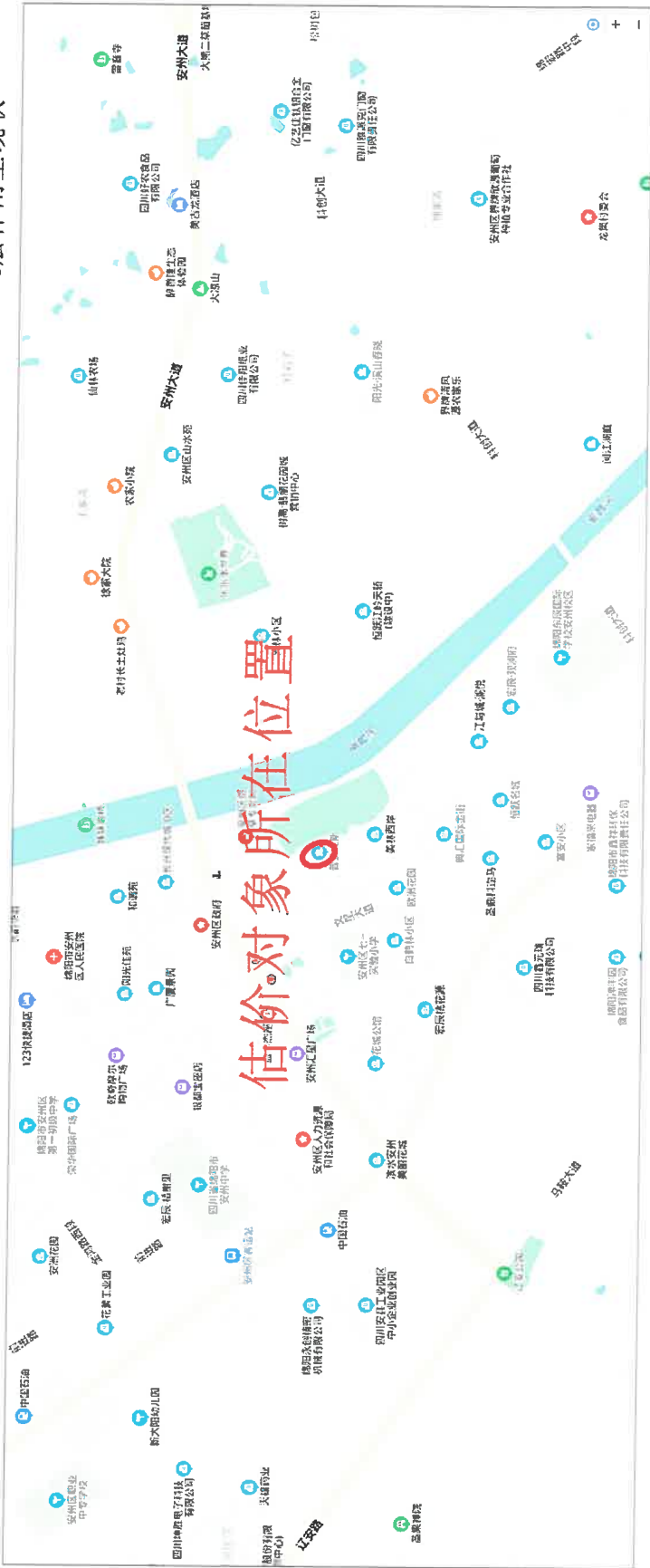
估价对象位置示意图