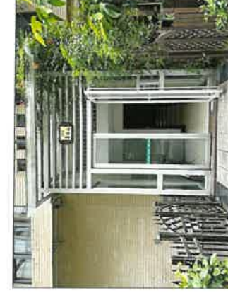
单元号及单元门入口现状