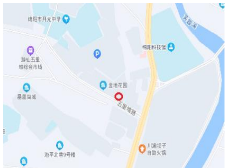
画圈处为估价对象所在位置