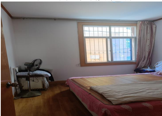
估价对象室内实景照片