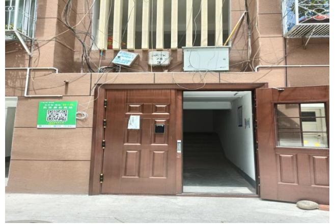
估价对象入楼门实景照片