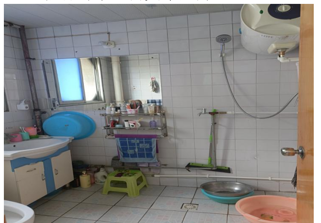
估价对象室内实景照片