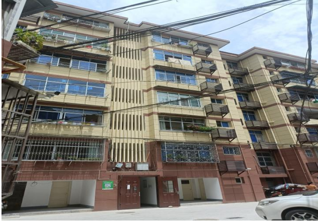
估价对象外观实景照片