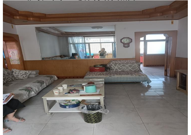
估价对象室内实景照片