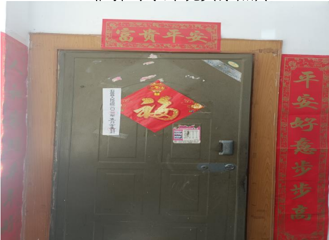
估价对象入户门实景照片