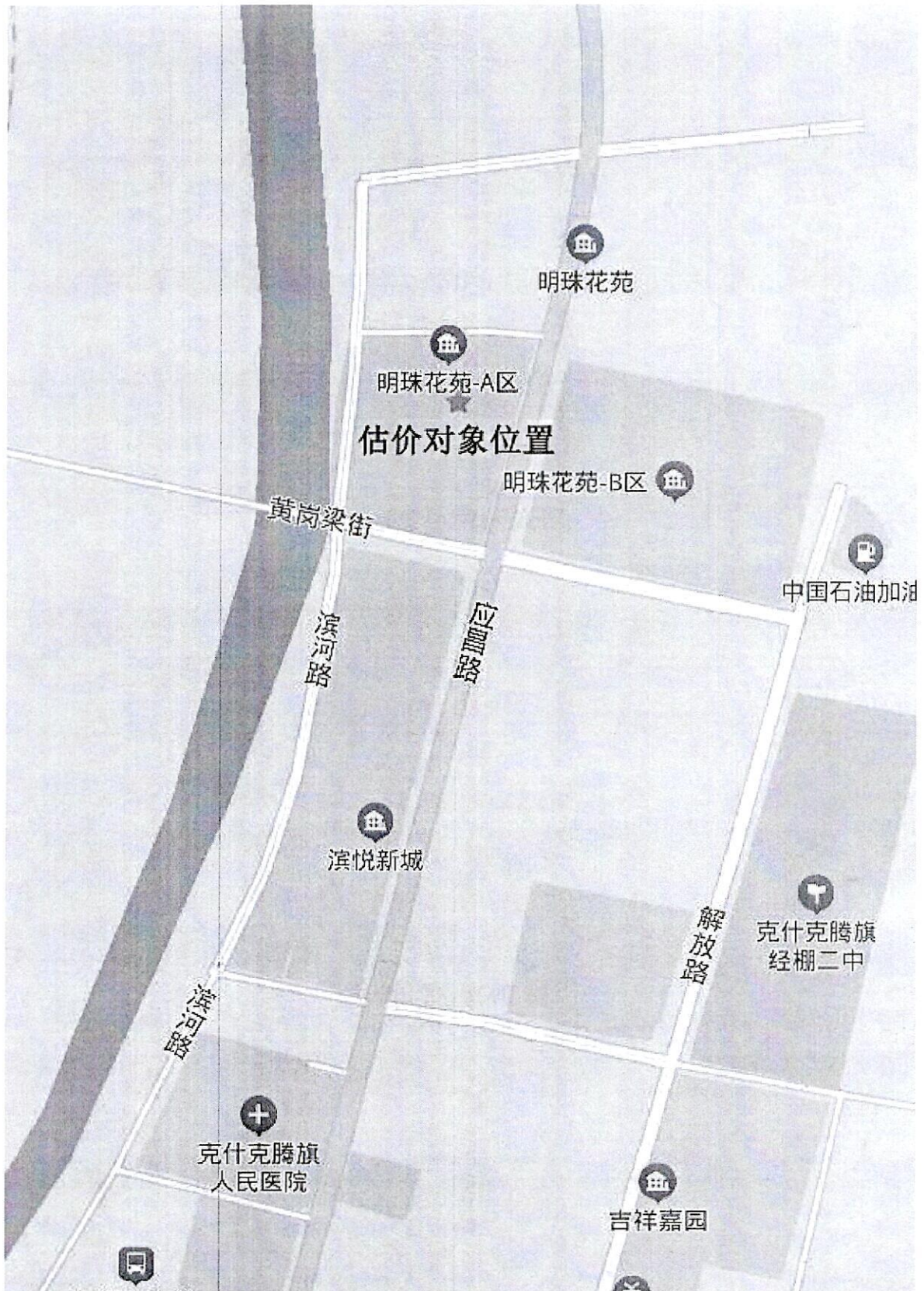
估价对象位置示意图