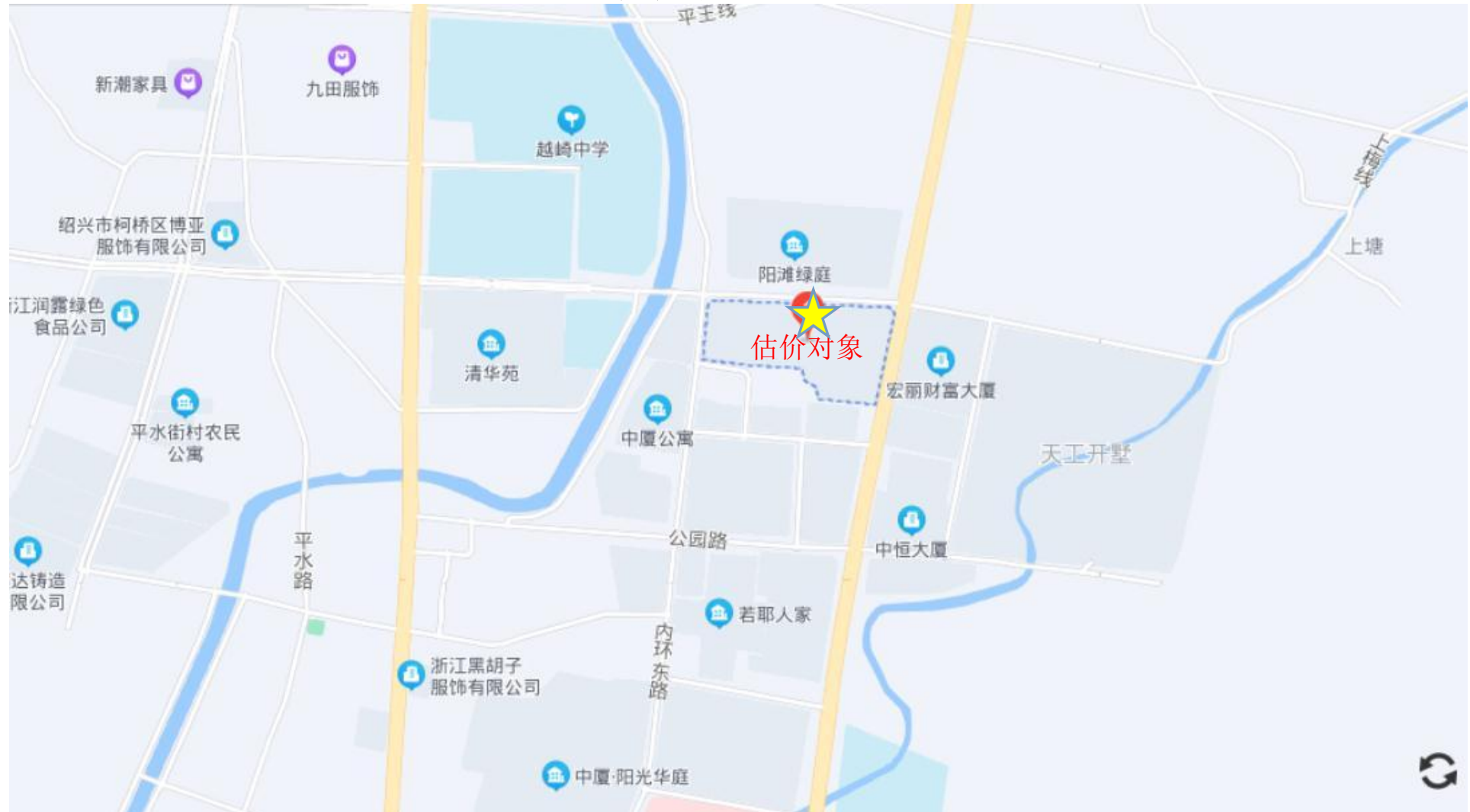
估价对象地理位置示意图