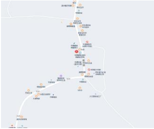
估价对象所在地理位置