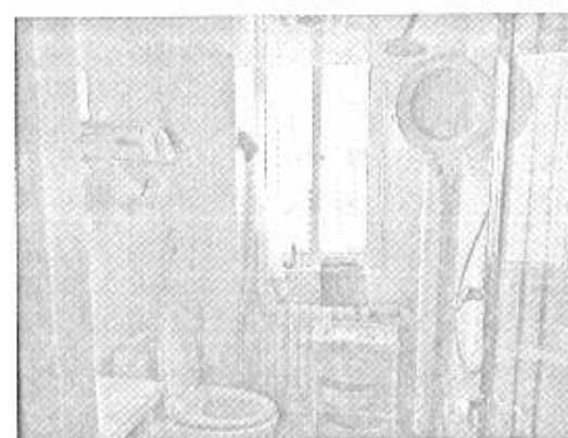
估价对象实物照片