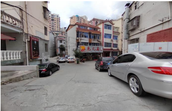
临路状况 3 (通道)