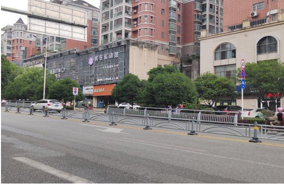
临路状况 1 (峡州路)