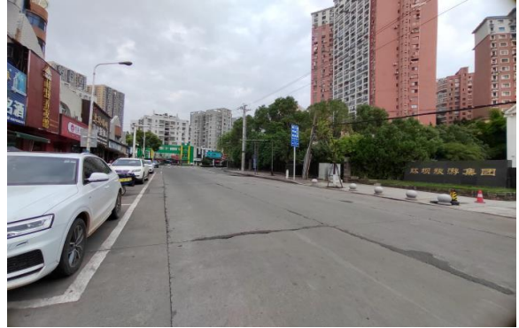
临路状况 2 (三峡路)