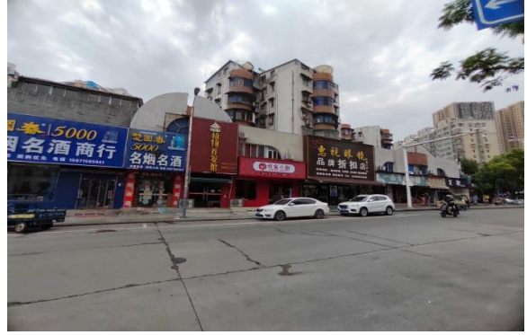
大楼外观 1 (正面)