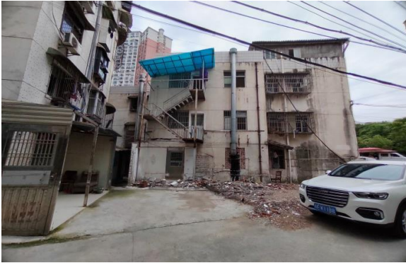
大楼外观 2 (背面)