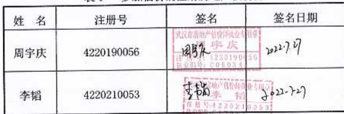
表 1 参加估价的注册房地产估价师

5、没有人对本估价报告提供重要专业帮助，本报告由注册房地产估价师（见表 1）完成。